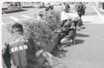
清掃活動(アダプトプログラム)