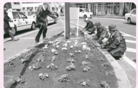
ペチュニア植栽(4月)