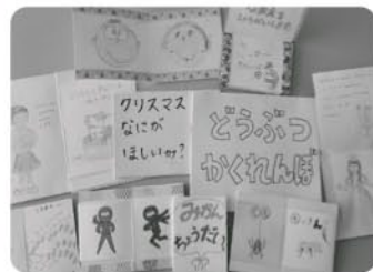
忍者絵本を作ろう!

次回ワークショップは4月の初めごろを予定しています。申し込み、準備は不要で参加できますので、ぜひ中央図書館にお立ち寄りください。そしてできれば、作品展ものぞいていってくださると嬉しいです。