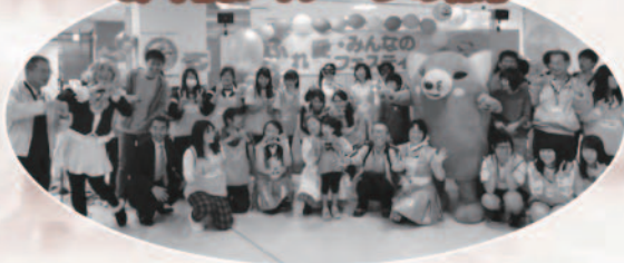
昨年度フィナーレの様子