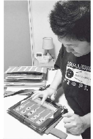
ipadアプリを使って自分らしい生活を確立!