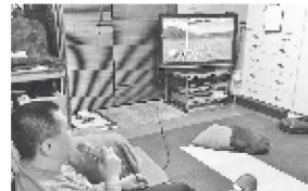
父母は近所で別に暮らし、僕は自宅で楽しい生活♪