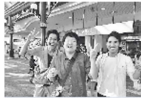
ヘルパーさんと暮らし・おでかけ(^^)v