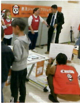
11月9日開催 えがおフェス2025（豊川市）

この三河の地でも、地域に密着し、数多くのイベントと共催しながら、損害保険会社として「防災」の重要性を伝え続けていきますので、見かけたら是非お立ち寄りください！