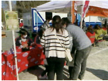
1月18日開催 新城消防祭（新城市）