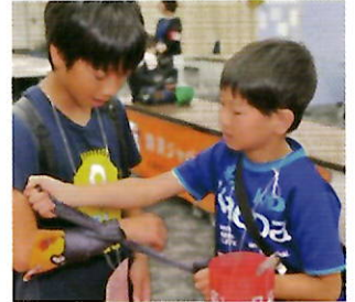
▲応急手当ワークショップの様子

当社は、子どもとその保護者を対象とした体験型防災ワークショップ「防災ジャパンドプロジェクト」を全国各地で開催しており、2025年3月末までに累計約126,000人の方にご参加いただきました。平時からの防災知識を学ぶことで、災害時の安全な行動と、地域や近隣で助け合う手段の習得を目的に、今後も自治体や企業とイベントを共催し、幅広い年齢層を対象としたワークショップを開催してまいります。